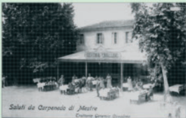
Salotti da Carpenedo di Mestre